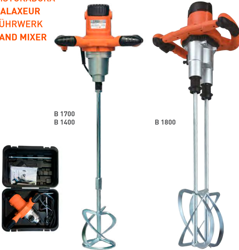
B 1700 B 1400